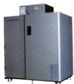
AGR- 800EX 平成15年 製 (2003年)