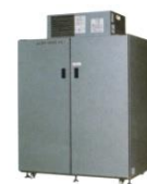
AGR- 850EX・1350EX 平成16-18年 製 (2004~2006年)