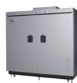
AGR- 24SJA・ 30SJA・36SJA 平成19-20年 製 (2007~2008年)