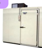
AGR- 2500・ 5000・7500 平成8-17年 製 (1996~2005年)