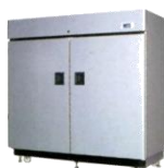
AGR- 24SJ・35SJ 平成18年 製 (2006年)