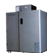
AGR- 1500EX 平成15-18年 製 (2003~2006年)